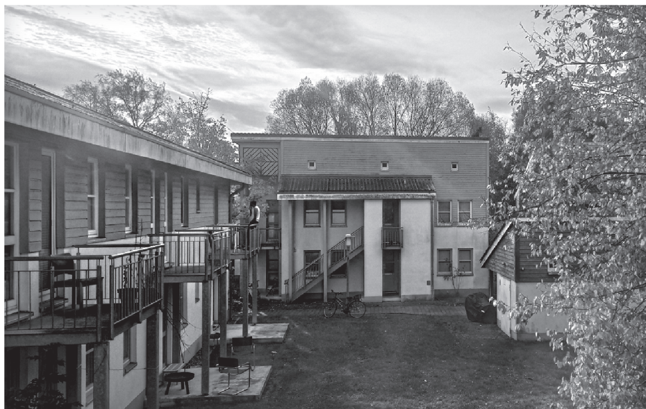
Так выглядело наше общежитие

воротник, дохожу до все еще открытой пекарни, спрашиваю улитку со штрейзелем. Улитка, как ей положено, ползет медленно. Подгоняю ее кофе, то и дело опуская стаканчик на скамейку напротив памятника университетским отцам-основателям. На скамейке крест-накрест наклеен пластырь — это был бы красивый знак, но я не умею его читать. Стою и почти бездумно растягиваю момент собственной бездомности, дышу плоским пробником мужского парфюма с шарфа — достался за просто так, претенциозен и пуст, но носить его бывает полезно: на пару часов хотя бы отбиваешься от себя, вроде как водишь себя за нос.