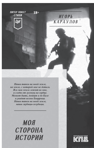
Обложка сборника Игоря Караулова

Этот момент истины — расставание с ложными ценностями постмодернизма — пришлось пережить многим отечественным интеллектуалам, возвращенным на беспочвенных идеях конца XX века. Для многих из них