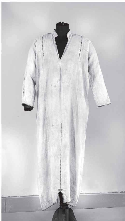
Мокшанская рубаха шам . Конец XIX в.

некоторых других. Для этого комплекта характерна туникообразная рубаха с клиньями в рукавах и вышивкой на плечах. Со временем эта рубаха становилась только нательной, поверх нее все чаще надевали своеобразное платье нула или закрытый передник с рукавами сапоня , вследствие чего количество вышивки на рубахах уменьшалось — в коллекции музея представлены две интересные мокшанские женские рубахи шам . Отличительной чертой мокшанских рубах являлось то, что по покрою они, как и эрзянские, были туникообразными, но расположение швов было несколько иное: перед и спину кроили из одного холста, перегнутого поперек, а бока — из двух более коротких холстин. Воротника у мокшанской рубахи также не было, а разрез на груди, как и у эрзи, был треугольный. Рукава мокшанской рубахи длиннее, чем у эрзянской, в вышивке преобладает черный и