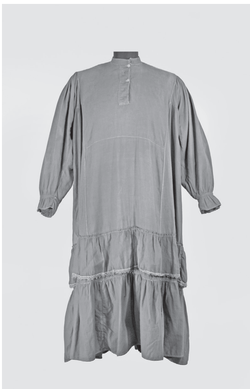
Платье нула . Начало XX в.