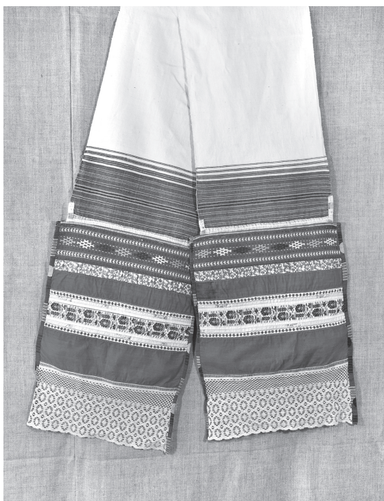
Сурпан, подаренный музею В. А. Петровым в 1987 г.

В Сибирском регионе марийцы (в отличие от других народов Поволжья) появились сравнительно поздно — в годы Великой Отечественной войны множество выходцев из Марийской АССР участвовали в строительстве промышленных гигантов Красноярского края. Во второй половине XX в. основной зоной расселения марийцев в Восточной Сибири был Красноярский край (2 204 человека) и Иркутская область (1 251 человек), в Западной Сибири — Кемеровская область (2 065 человек). В 1970—1990-е гг. продолжался приток марийцев (в основном в регионы Восточной Сибири), максимальная их численность на территории Сибири и Дальнего Востока составляла 23 582