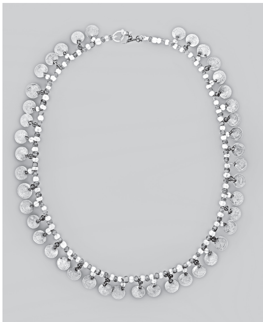
Мокшанские праздничные бусы ашконя

Оплечье в костюме мокшанки сочеталось с другими украшениями, в частности с гайтами (накосными украшениями) и бусами. В коллекции нашего музея